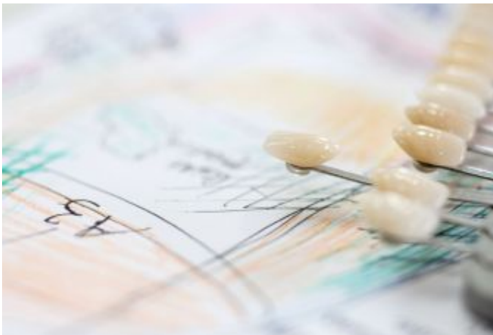
Die Basis für perfekte Ästhetik

Die Bestimmung der Zahnfarbe und der Charakteristika der Zähne ist eine entscheidende Grundlage für die Ästhetik des Zahnersatzes. Dazu werden Farbmuster in unterschiedlichen Farbtönen und Transparenzen genommen und mit den Zähnen des Patienten verglichen. Optimale Licht- und Umgebungsbedingungen sind die Voraussetzungen für eine korrekte Farbnahme.