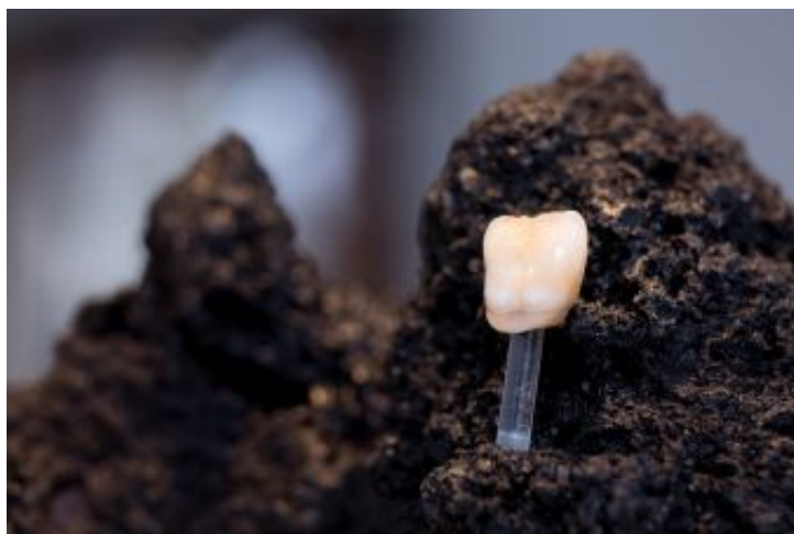
Die Natur als Vorbild

Mit Vollkeramik lassen sich überzeugende ästhetische Ergebnisse erzielen. Sie fördert das natürliche Aussehen des Zahnersatzes durch ihre hervorragenden Eigenschaften hinsichtlich Transluzenz und Lichtdynamik. Dazu kommt die sehr gute Körperverträglichkeit und die hohe Bruchfestigkeit.