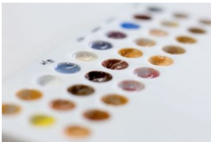
Die Kunst der Verblendung

Wir bieten unseren Kunden bzw. dem Patienten die Möglichkeit, Verblendungen aus Keramik und Polymerglas farblich an die vorhandene Mundästhetik individuell anzupassen und zu charakterisieren. Nach dem Prinzip des Maßanzugs kann der Keramiker auch die letzten Keramikbrände gemeinsam mit dem Patienten im Dentallabor durchführen.