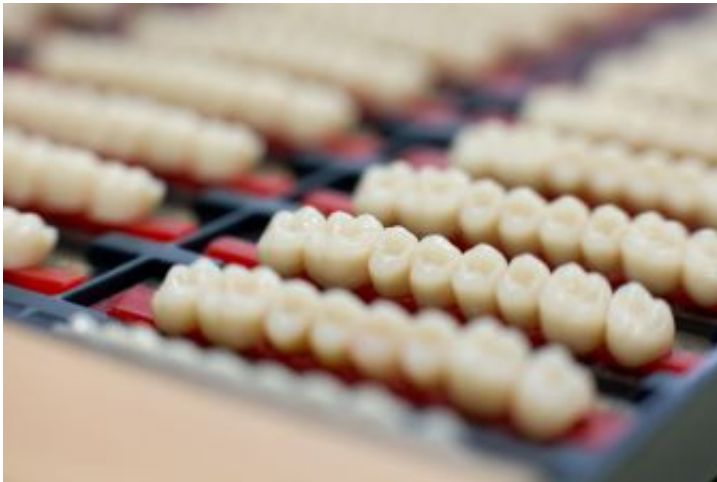
Prothesenzähne nach Wahl

Die Auswahl und Aufstellung der Zähne zusammen mit dem Patienten garantiert ein typgerechtes Ergebnis bei der fertiggestellten Total- oder Teilprothese. Im Patienten-Service-Center können wir mit dem Patienten hinsichtlich Form und Farbe auf ihn abgestimmte Konfektionszähne auswählen. Diese können wir auf Wunsch zusätzlich individualisieren.