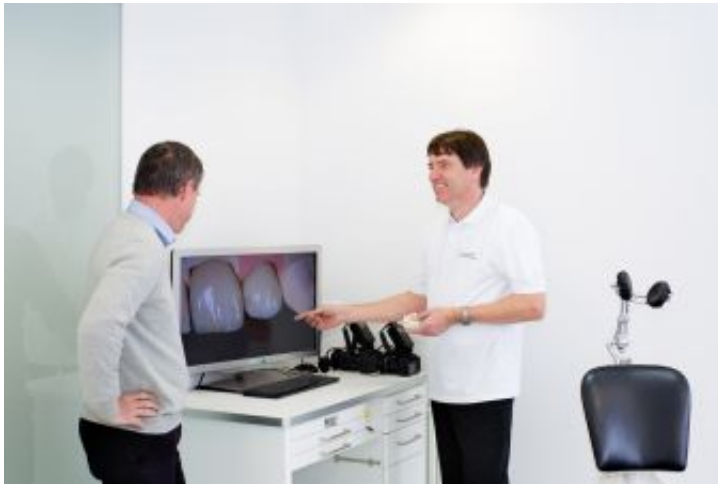
Technik gut erklärt

Grundsätzlich informieren wir Ihre Patienten nur dann, wenn Sie es wünschen. In unserem Patienten-Service-Center können wir dem Patienten mit Hilfe von zahntechnischen Arbeiten und Infomaterial zeigen, wie seine neuen Zähne aussehen können.