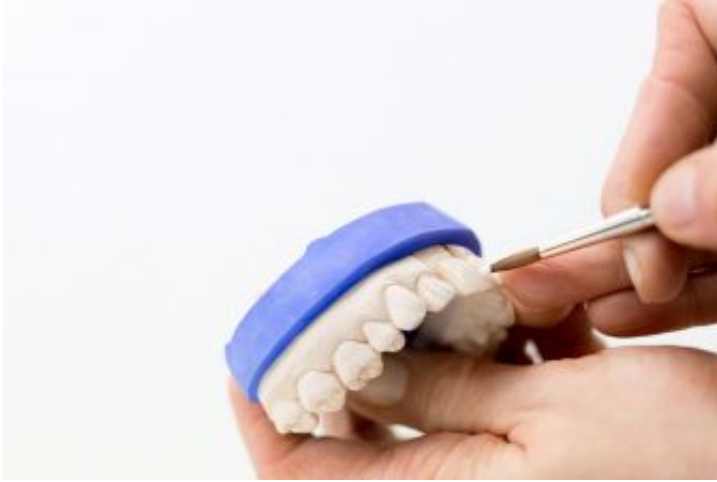
Wissenswertes über Zahnersatz

Wir wollen, dass Sie wieder richtig lachen können! Wir fertigen für Sie Zahnersatz mit höchsten Ansprüchen an Ästhetik und Funktion. Unsere Informationen sollen Ihnen helfen, Zahnersatz besser beurteilen zu können und die für Sie beste Lösung zu finden.