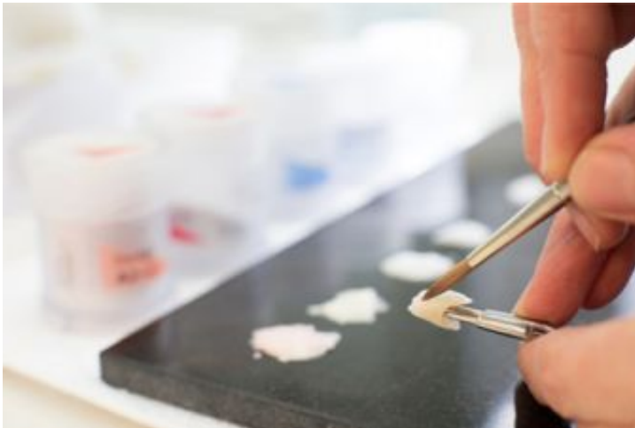
Handarbeit mit Präzision

Schritt für Schritt zu Ihren neuen Zähnen