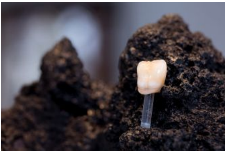
Jeder Zahn ist wichtig